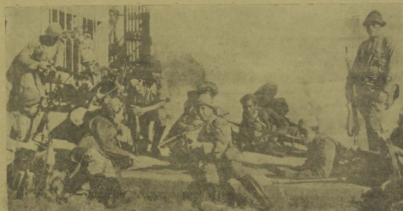
A REBELLIÃO PAULISTA: — Uma patrulha avançada nas linhas de fogo, em repouso, entretanto, os fuzis em prom. pitão.

RIO, 25 — (PELO RADIO) — REGRESSANDO DESTA CAPITAL O GENERAL GÖES MONTEIRO INSPECIONOU, DEMORADAMENTE, AS LINHAS DE FRENTE DO SECTOR MINEIRO, RETORNANDO, A SEGUIR, A SEDE DO SEU ESTADO MAIOR, EM REZENDE, COLHENDO DE TUDO QUE VIU A MELHOR IMPRESSÃO. (A UNIAO).