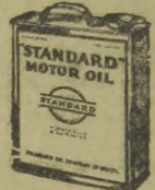
"Digno da responsabilidade"