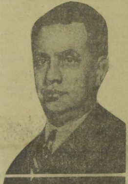
General Góes Monteiro

Nesse sentido o general Góes Monteiro já tem prompto o seu trabalho, no qual, entre outras coisas, determina o serviço militar obrigatorio a todos os brasileiros de vinte e um annos, comprehendendo-se também as mulheres que não poderão ter direitos civis e politicos sem que apresentem certificados de alistamento militar, prestando ellas serviço de enfermeiras da Cruz Vermelha. (A União).