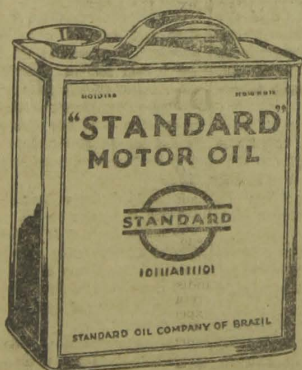
"Digno da responsabilidade"

Fal-o-á, si fôr "Standard" Motor Oil, pois este lubrificante é bastante resistente para supportar temperaturas muito maiores que vosso motor jamais desenvolverá, em condições normaes de uso.