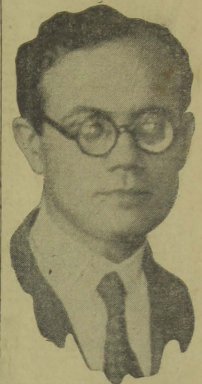
Ministro José Americo