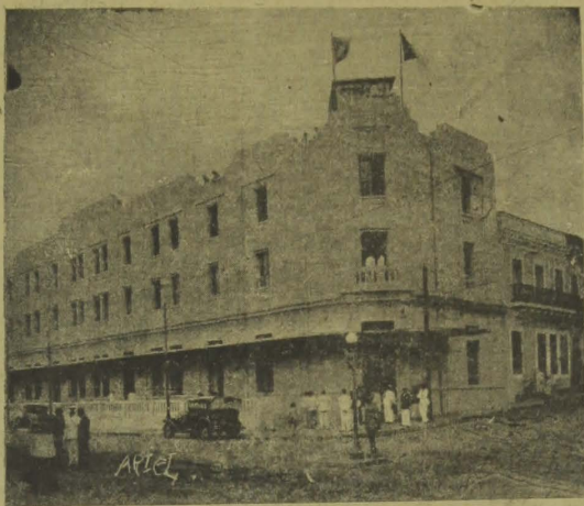
Fachada do "Parahyba Hotel"