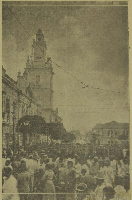
Um flagrante da multidão que acompanhou os restos mortaes do mallo, grado interventor ao desfilar deante do "Palacio da Redenção".

A fim de realizar-se uma limpeza geral nas linotypos e machina impressora desta folha, A União somente circulará no proximo sabbado, funcionando, entretanto, as demais secções da Imprensa Official.