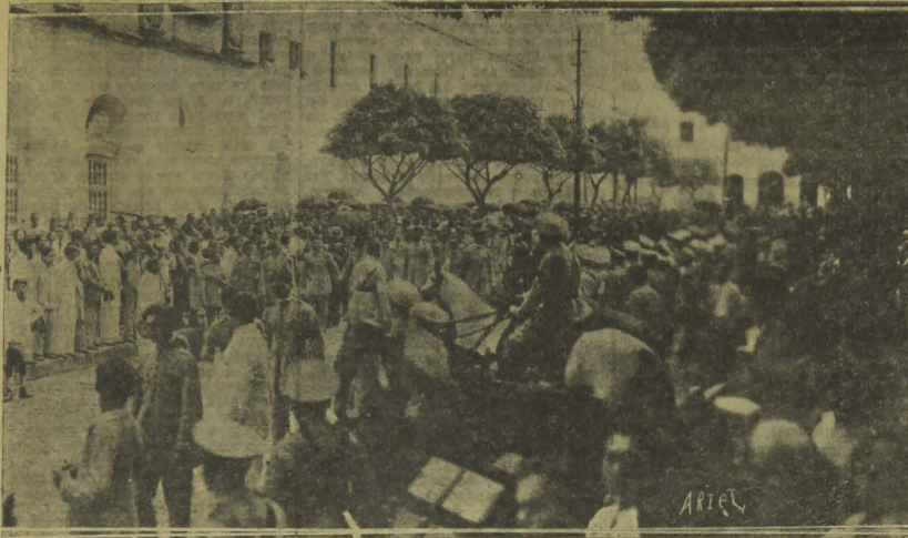
Outra photographia tirada na occasião em que o prestígio funebre se encaminhava pela avenida General Osorio