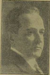
Presidente Getulio Vargas

O espirito renovador de depois da guerra denota certa tendencia impondosa a substituição do justo pelo util como finalidade sociologica. Entre nós, a mudança dos quadros sociais e politicos da actualidade não podem realizar-se sem ser alterada a legislação actual, inclusive a Constituição. As preoccupações desses assumptos tornaram tal reforma tão empolgante que os partidos politicos, cujos programmas sejam estranhos aos factores economicos, não conseguirão interessar a opinião publica, ficando condemnados a esterilidade de mesquinhas rixas locais. A época é das assembleias especializadas, dos conselhos technicos integrados na administração. Podemos considerar o Estado puramente politico, no sentido antigo do termo, uma entidade amorpha actualmente perdendo o seu valor e a sua significação."