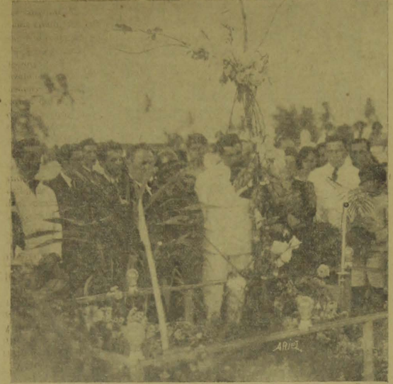
A família Navarro e amigos em visita ao túmulo do malgrado interventor Anthonor Navarro

Fôram muito tocantes as homenagens prestadas pela população no dia de ante-hontem, consagrado aos mortos.