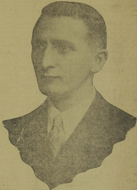
Dr. Argemiro de Figueiredo

No Palacio da Redempção, effectou-se ante-hontem, ás 12 horas, a investitura do dr. Argemiro de Figueiredo, secretario do Interior e Justiça no cargo de Interventor interino, por ter o dr. Gratuliano viajado naquella data com destino á metropole do país.