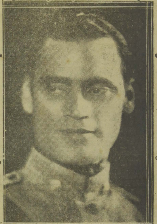
MINISTRO JUAREZ TAVORA

E' esperado amanhã, nesta capital, o eminente procer revolucionario maior Juarez Tavora, que vem, desde janeiro deste anno, desempenhando com invulgar apuro e intelligencia, as altas funções de ministro da Agricultura.