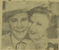
Elle e ella de "Fogo e Fumaça."

Fogo e Fumaça: — Na tela desse casino de Empresa Cinematographica Parahybana será focado hoje e amanhã o "film" da "Warner-First" movietone Fogo e Fumaça,