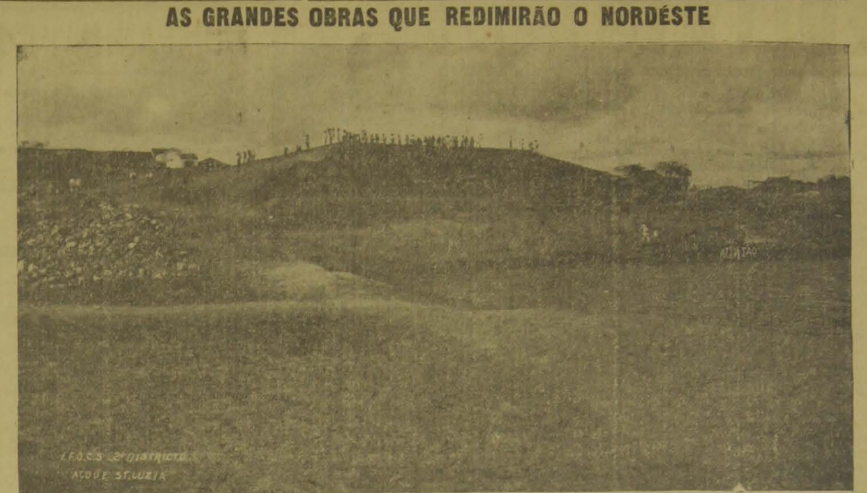
Vista do açude "Santa Luzia"

Art. 1.º — Fica obrigatorio o uso da ortografia resultante do acôrdo entre a Academia Brasileira de Letras e a Academia das Ciências de Lisboa, a que se refere o decreto n.º 20.108, de 15 de junho de 1931, no expediente e publicações dos órgãos do Poder Judiciario, no dos Urmas, nos Colegios ou ginasios, nas escolas primarias e demais estabelecimentos de ensino, publicos ou fiscalizados.