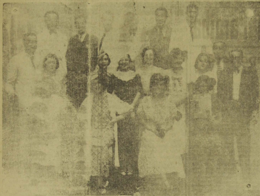
Companhia Argentina. O Espetáculo Tipico que vem obtendo repetidos êxitos no cine-teatro Rio Branco

GRATULIANO DA COSTA BRITO ERNESTO GEISEL