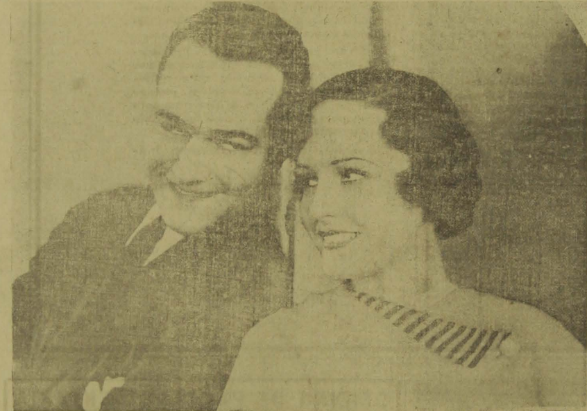
William Haines e Madge Evans em "A toda velocidade" em exhibição no "Santa Rosa"