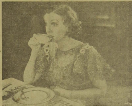
Zasu Pitts, numa cena do filme Obrigado a Casar

NOTÍCIAS CHEGADA DE AVIAO 1.º — Alemanha — O processo do Reichstag vai continuar em Berlim. 2.º — Polónia — A cavalaria polo-