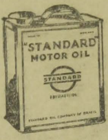
"Digno da responsabilidade"

Por fóra o calor é insupportavel — mas dentro do motor o oleo combate temperatura CINCO vezes maior