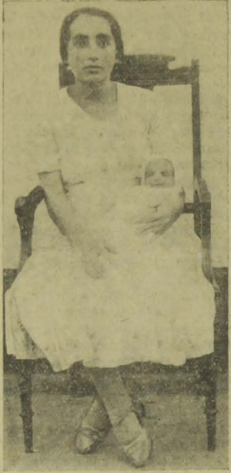
A operada e a creancinha salvos