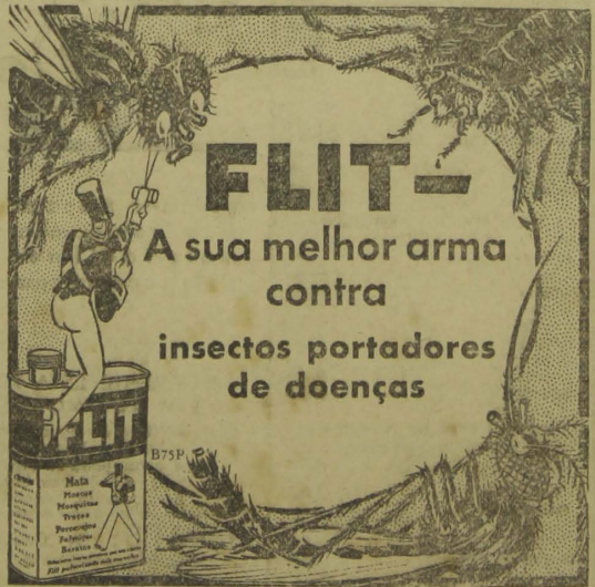
Acha-se á venda o estojo combinação: Pulverizador miniatura e latinha de FLIT — Preço 58000

EDITAL DA JUNTA COMMERCIAL DO ESTADO DA PARAHYBA — Mês de janeiro de 1933 — A Junta Commercial do Estado da Parahyba, faz publico que durante o mês de jan-