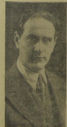
Ministro Oswaldo Aranha