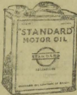
"Digno da responsabilidade"