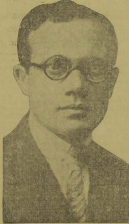
MINISTRO JOSÉ AMERICO

RIO, 14 — (Nacional) — Do tenente Walter Pompeu, recebeu o ministro José Americo, o seguinte telegramma: "São Paulo, 6 — Compareci hontem á sessão civica no Thea-