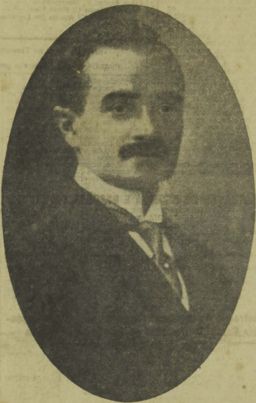
O Grande Presidente que se sacrificou defendendo os brios de nossa terra e cujos exemplos de dignidade e de civismo inspirarão, hoje, o eleitorado da Parahyba, elegendo os candidatos do Partido Progressista á proxima Constituinte.