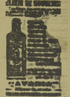
Um conselho de amigo — Experimentem o café "PURO" MOINHO PARAHYBA