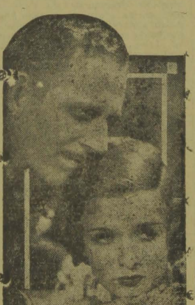
Joan Bennett weighs the wealth of James Kirkwood against the love in her own heart in the Fox romantic drama, "She Went to a Millionaire".

narios lances emotivos, de enredo policial. Basta dizer-se que "Ella queria um millionario" tem como protagonistas o admiravel duo Joan Bennett e Spencer Tracy, que Alfred Santell conseguiu reunir nessa encantadora produção, onde se destaca o concurso de belleza que se realizou nos Estados Unidos, em 1931. Abriu á sessão um modernissimo "Journal" sonoro, com as mais recentes novidades do mundo. NAO annunciem sem primeiro indagar qual o jornal de maior circulação no Estado.