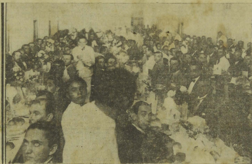
Aspecto do banquete oferecido pelas classes conservadoras e liberaes ao ministro José Americo

Seria ocioso, exmo. sr., vir eu aqui usar de adjectivação para exprimir as qualidades que ornão o vosso caracter ou fazer enumeração das obras que haveis realizado porque, essas são por todos reconhecidas e aquellas já se acham positivamente objectivadas