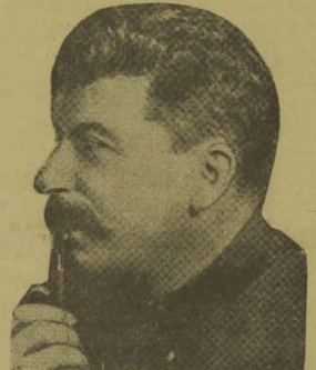
O sr. Stalin, presidente da Republica Sovietica

MOSCOU, 7 — A Agencia Tass annuncia que por ocasião do 16.º anniversario da Revolução Sovietica desta capital, realizou-se uma sessão plenaria na qual o sr. Molotof, presidente do Conselho dos Commissarios do Povo, leu longo relatório em que mostrou o grande desenvolvimento alcan-