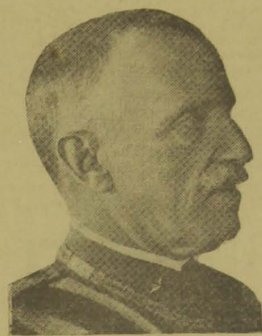
S. M. Rei Victor Emanuel