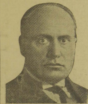
Sr. Mussolini, novo ministro da Marinha e Aeronautica