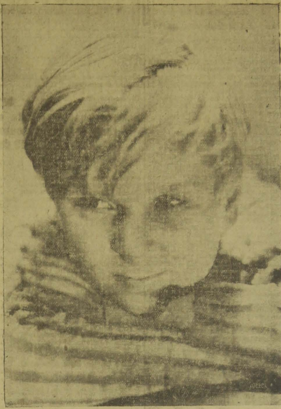
JACKIE COOPER, o principal interprete desse filme que desliza hoje no "Santa Rosa".

A impemencia das cenas, a riqueza da montagem, o arrojado da concepção, o ineditismo, a dramaticidade tudo nesse filme contribui para sagrar-lo uma das maiores produções da arte cinematografica.