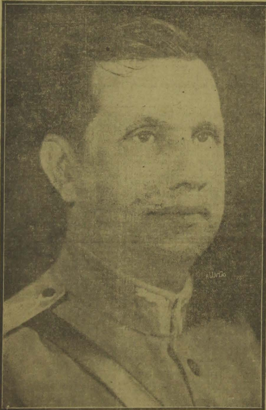
O GRANDE CHEFE DO EXERCITO NACIONAL

"A candidatura do sr. Getúlio Vargas parece-me mais de acôrdo com a natureza das coisas.