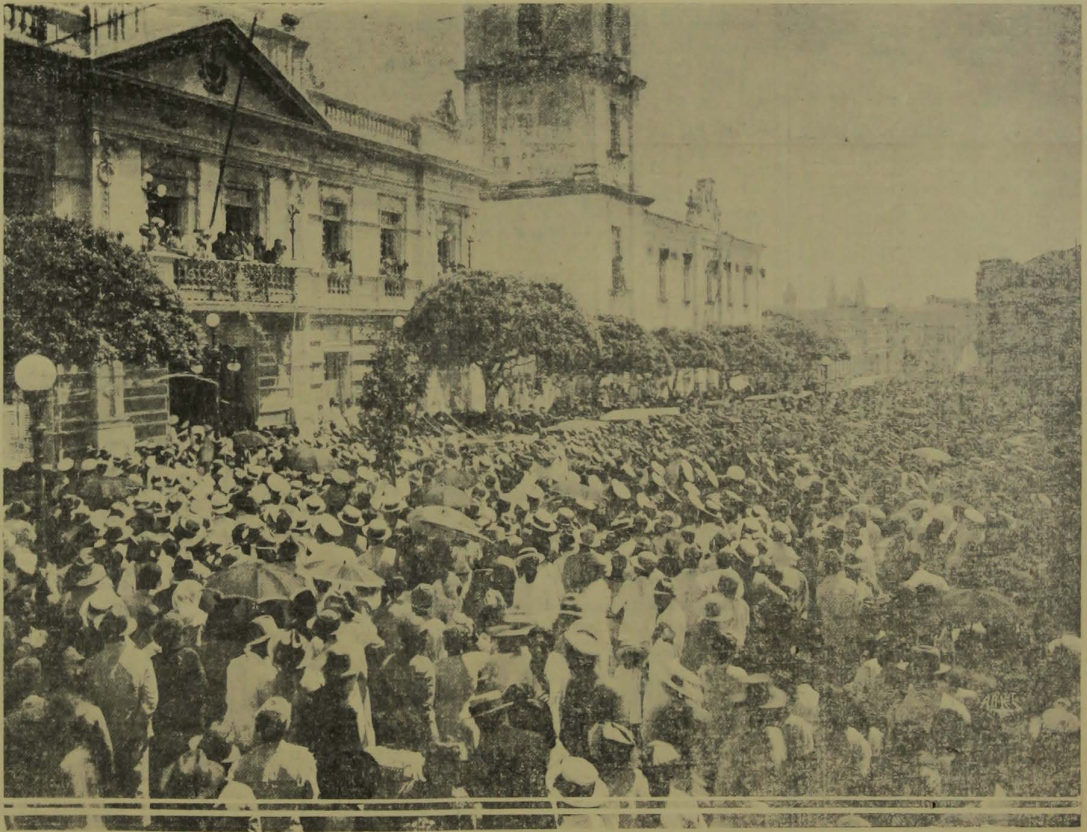
A multidão em frente ao Palacio da Redempção, na occasião em que discursava o embaixador José Americo