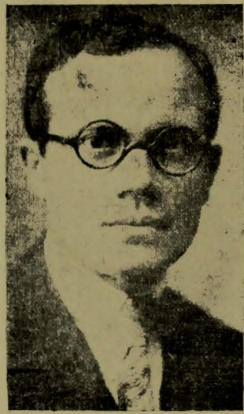
RIO, 9 (Nacional). — O ministro José Americo enviou aos jornais a seguinte nota:

“Em face do repto que lhe dirigiu o ministro José Americo, para que formulasse, imediatamente, as accusações que conforme declarara da tribuna da Assembleia pretendia apresentar contra o Ministerio da Viação, baseado em dados e documentos em seu poder, por ocasião do exame dos atos do governo, o capitão Rui Santiago transmitiu-me ontem o seguinte telegrama: “Acuso o recebimento vosso telegrama restando formular imediatamente accusações vossa administração tribuna Assembleia Constituinte e oferecendo franquias todas dependências Ministerio Viação, a fim de retirar documentos, agradeço gentileza oferecimento pedindo expeça ordens diretores Central do Brasil, Correios e Telegrafos sentindo facultar todas facilidades possa obter dados officiais completem prova vossa nefasta administração publica, interesses economicos, sociais cidadãos tiveram desgraça depender vossa acção. Achei inutil falar vossa telegrama em melindres morais e responsabilidades publicas, todos brasileiros estão suficientemente capacitados, ante vossa passado, tendes horror responsabilidades. Saludos ficticios apresentastes. Lote de Brasileiro deamentidos publico.”