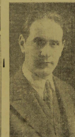
Sr. Osvaldo Aranha

RIO, 19 — (Nacional) — Retardado — O governo enviou aos jornais seguinte nota: "Em virtude do resultado da reunião hoje realizada no Palacio Tiradentes, presidida pelo general Flores da Cunha, da qual participaram os ministros José Americo,