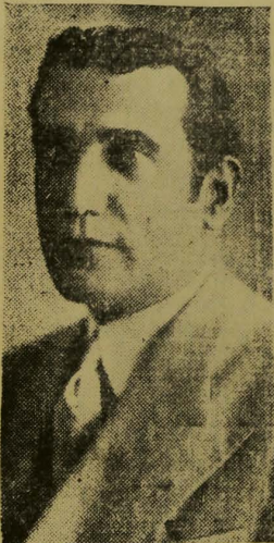
Interventor Pedro Ernesto

Rio, 26 (Nacional) — Os funcionários da Prefeitura desta capital vão oferecer, hoje, uma espada de ouro ao interventor Pedro Ernesto, por motivo da sua nomeação para coronel medico do Exército de 2.ª Linha. — (A União).