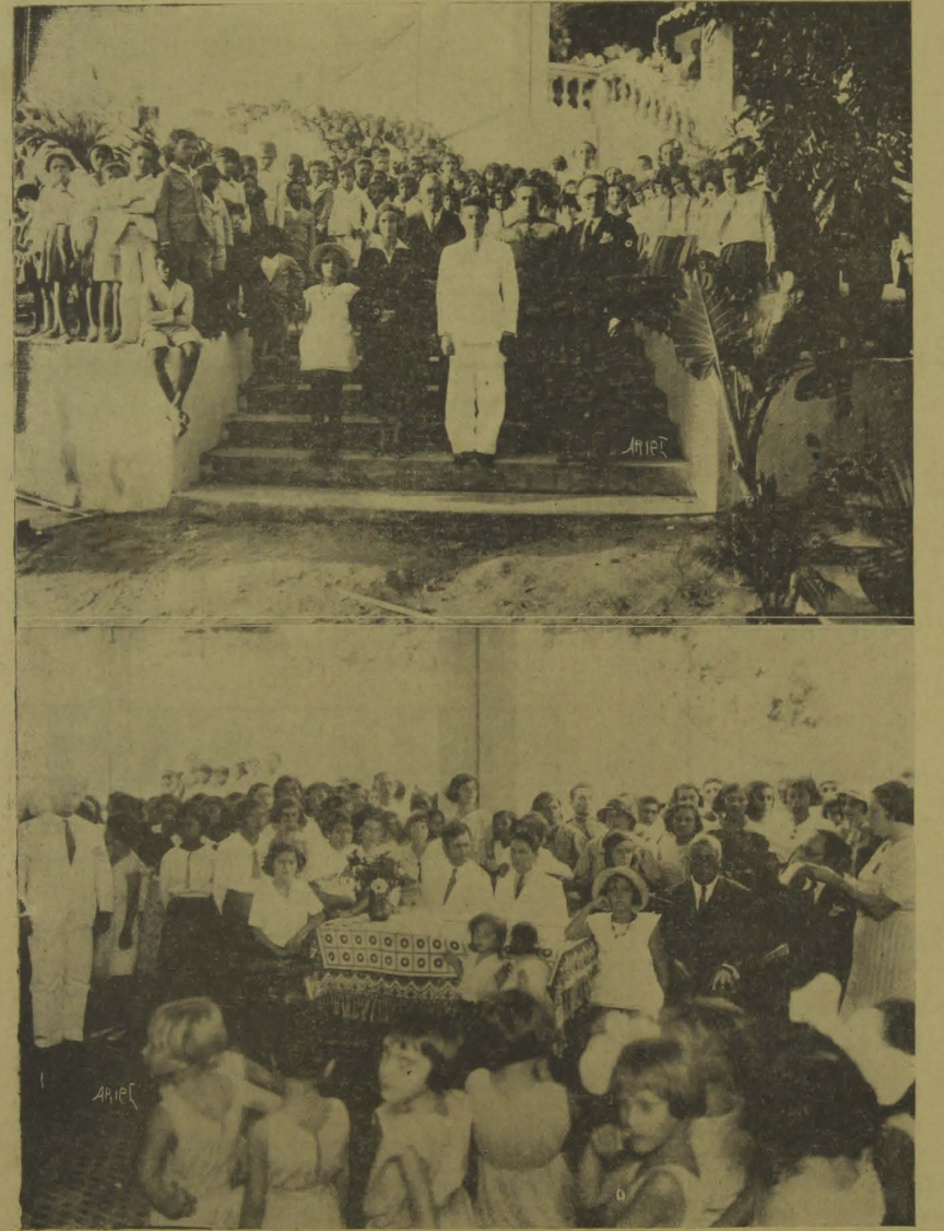
Aspectos da inauguração do Jardim da Infância, ocorrida ante-ontem.