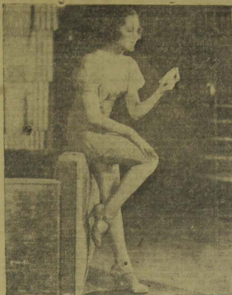
Chamam-na "A namorada de Hollywood..." E bem apropriadamente fica este apelido á "petite" MARY BRIAN que vamos tornar a ver em "LUAR E MELODIA", a começar de sábado no "RIO BRANCO".