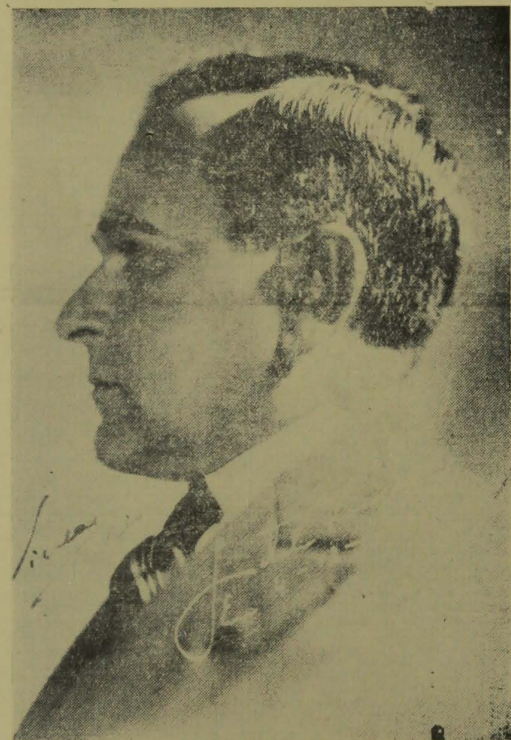
SR. GETULIO VARGAS, primeiro presidente constitucional da Segunda República.