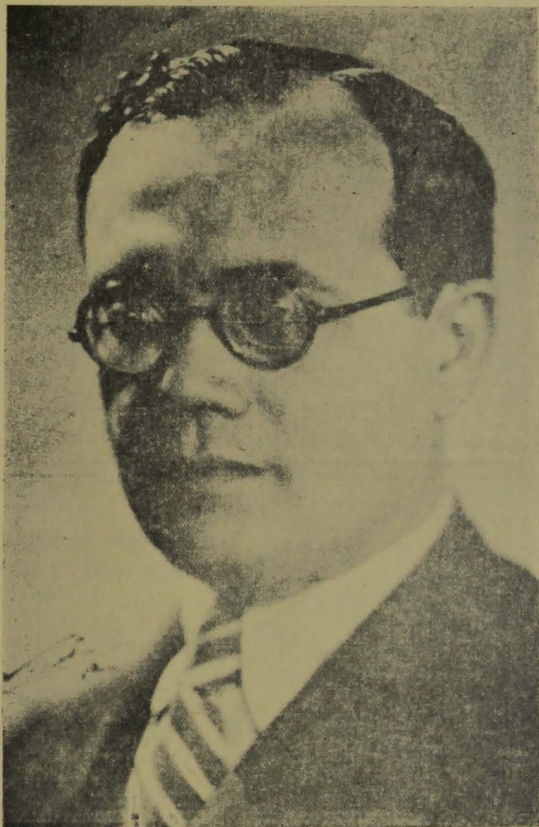
EMBAIXADOR JOSE AMERICO DE ALMEIDA

A PROXIMA VISITA DO EMINENTE BRASILEIRO À PARAIBA