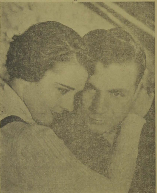
RUBY KEELER e DICK POWELL, a dupla de "Rua 42", numa cena da opereta-revista "Cavadoras de Ouro", a ser focada sabado proximo, no "Santa Rosa".

Sim... Toda a cautela será pouca! Tratem de segurar os maridos em casa ou, se não for possível, não os deixem