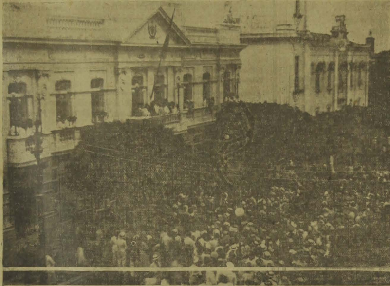
O povo em frente ao "Palácio da Redenção"

Mas estava contente do que já conseguira, embora poucos compreendessem e sentissem os efeitos da sua orientação. Certo os benefícios dessa política de economias e restrições não se podiam manifestar agora. Só as gerações de amanhã diriam se ele acertara ou não, porque nenhum julgava.