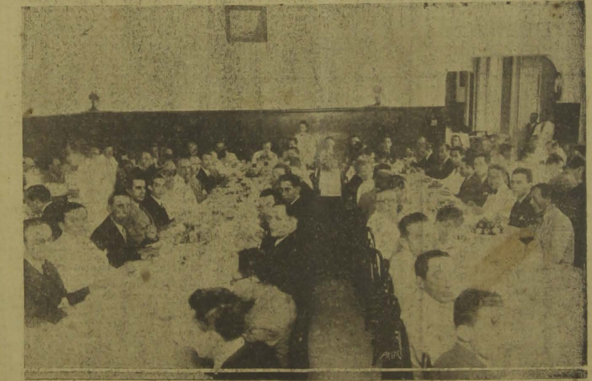
Outro aspêcto do banquete.