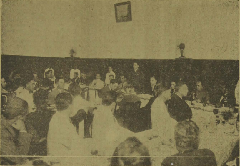
Aspêcto da mesa do almoço realizado no "Paraíba-Hotel".