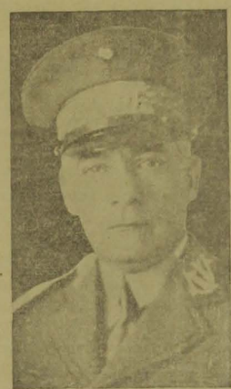
General Daltro Filho

RIO, 4 (Nacional) — Confirmando a noticia enviada, ante-ontem, podemos adiantar que o general Daltro Filho não mais voltará ao comando da 2.ª