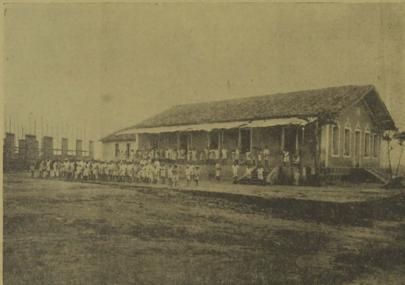
O atual alojamento de menores do Centro Agrícola "Presidente João Pessoa", vendo-se, à frente, um grupo de alunos.

tral, para alojamento dos menores, as quais já se encontram muito adiantadas, conforme se vê do clichê que hoje estampamos.