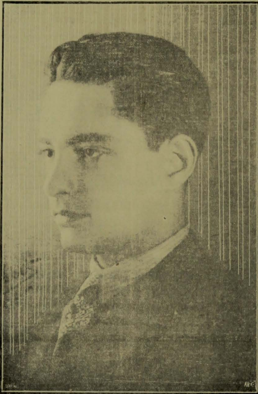
INTERVENTOR GRATULIANO BRITO

O próximo regresso do Chefe do Governo paraibano e as homenagens que lhe serão prestadas