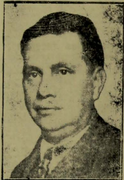
O grande chefe do Exército Nacional.

Rio, 15 — (Nacional) — O general Góis Monteiro concedeu a seguinte entrevista: “O programa delineado para dotar o nosso exercito de todos os caracteristicos de força operante, ponderavel e eficiente está sendo desenvolvido por todas as partes desse grande e complexo organismo