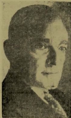
Almirante Protogenes Guimarães, ministro da Marinha, a cuja ação se deve o proximo rearmamento do nosso poder naval.

RIO, 15 — (Nacional) — Efeituouse, sobre a presidencia do almirante Anfiloquio Reis, o ato