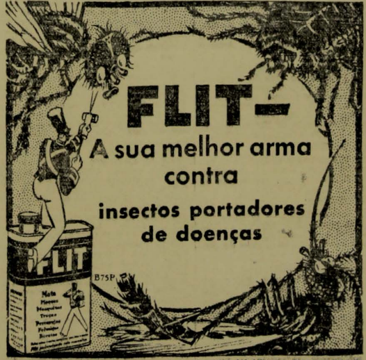
Puilverizador miniatura e latinha de FLIT Preço 32000

Canções tão lindas como as de A VOZ DO MEU CORACAO, v. s. já-mais ouviu Ouvindo-a esquecerá muitas mágoas, sentindo a alegria de