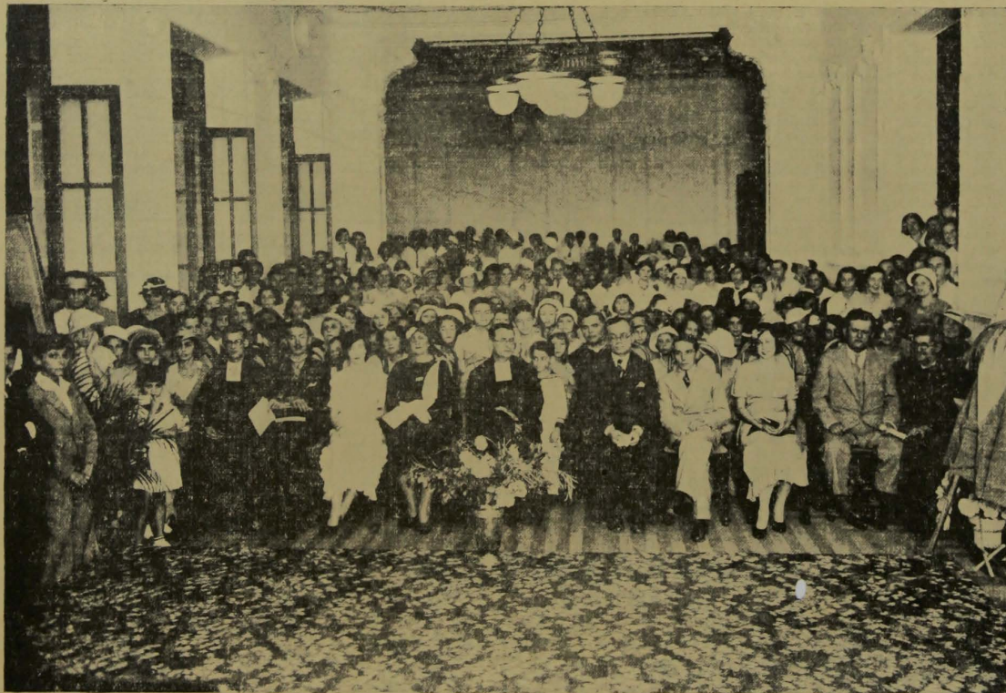
Grupo apanhado no salão nobre da Escola Normal, durante a "HORA BRANCA", promovida pelos escolares em honra ao embaixador e embaixatriz José Americo.