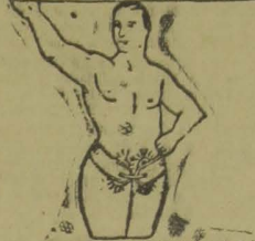
CINTO LUYA invisível

O cinto orthoplastico do prof. Lazzarini é um maravilhoso aparelho feito sob medida, sem nenhuma mola de ferro, completamente de tecido elastico leve, permitindo aos enfermos montar a cavallo, fazer qualquer trabalho sem fadiga, contendo a mais volumosa quebradura, a qual fica fixada em brevisimo tempo.