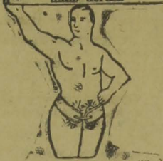
CINTO LUVÁ invisível