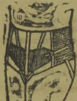
Cintura para Prosis (estomago cahido)