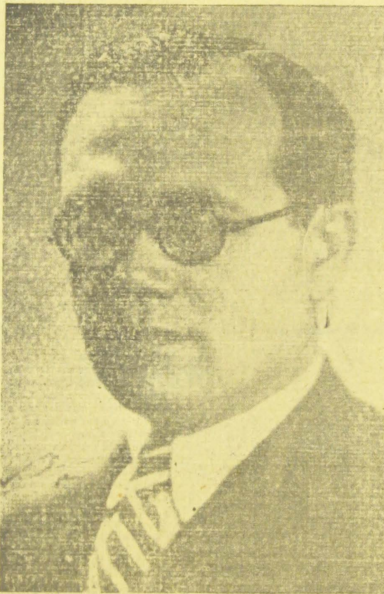
SENADOR JOSÉ AMERICO a mais alta expressão de estadista e de patriota da Parahyba nova.

"A PARAHYBA, PELO SEU GOVERNO E PELA QUASI TOTALIDADE DO SEU POVO NÃO PODERIA JAMAIS SE CONFORMAR COM ESSA ATTITUDE DE ALHEIAMENTO DO SEU DIGNO FILHO Á VIDA POLITICA DO ESTADO E DO BRASIL"