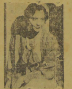
Sylvia Sidney vai voltar em "Quando a mulher se oppõe" breve, no "Rio Branco".

E, por fim, tornando encantadora a sua moldada de amanhã, dedicada ao mundo feminino de João Pessoa, o "Rio Branco" fará apresentar no palco em esplendidos números do seu bello repertorio, o mavioso conjunto que nos visita — "Turistas Bohemios", brevede proccos populares para as senhoras e senhoritos que pagam apenas 1500 para o soberbo espectáculo que lhes será oferecido.