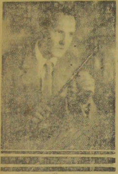
Fredric March, que nos dará dois belos filmes no "Rio Branco": "Quando a mulher se oppõe" e "Sócios no amor".

ESTÃO ANUNCIADOS GRANDES FILMS PARA 1935 — EM DESFILE AS PROGRAMMAÇÕES DA EMPRESA CINEMATOGRAFICA PARAHYBANA E CIA. EXHIBIDORA DE FILMS S/A — AS MELHORES MARCAS E OS MAIS APPLAUDIDOS ARTISTAS