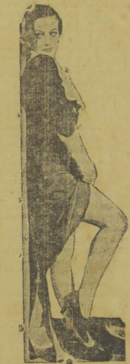
Joan Crawford, a genial "estrela" da "Metro", que reaparecerá no "Santa Rosa", em "Tres amores".

A Cella dos Accusados — Com William Powell e Myrna Loy.