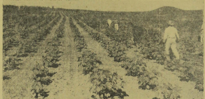
Campo de coopeção "Medeiros", no municipio de Ingá, (28 hectares de algodão "Texas", 7.104).

Somente uma nota triste tocou-me, nessa provelosa excursão, e foi o ser informado, por pessoas de Ingá que na vila e arredores havia numerosos casos de impudalismo. Esse facto confirmou-me, momentos depois, o pro-