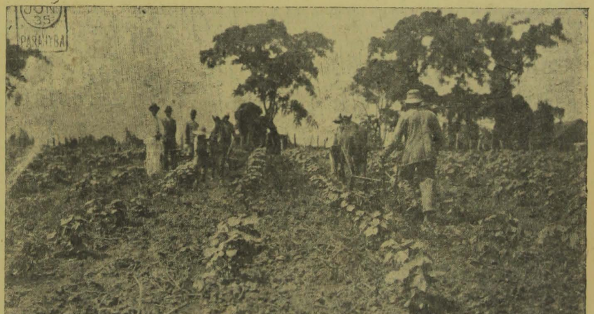
Campo "Corredor", no municipio de Pilar, quando se procedia á capina mecanica (Area: 20 hectares).

Por motivo de se ter partido a antenna da estação respectiva, deixou de ser feita a irradiação de hontem. Espera o "Radio Club" remover hoje esse imprevisto.