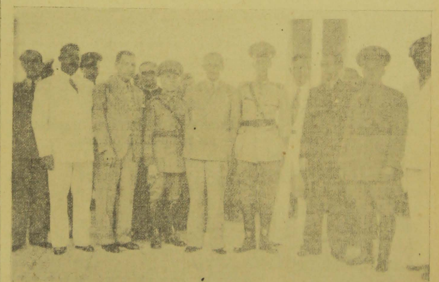
Grupo onde se ve o sr. Governador do Estado entre o coronel Campello e o major Alfredo Bamberg, commandante do 22.º Batalhão de Caçadores.

tendo as danças se prolongado até ás 22 horas. Nas solenidades do juramento á