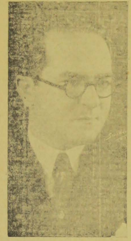
Deputado Lauro Wanderley

zado o serviço de tachygraphia da Assembléa.