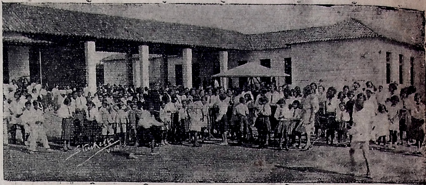
Outro aspecto da inauguração dos novos melhoramentos do Grupo Escolar "Santo Antonio"