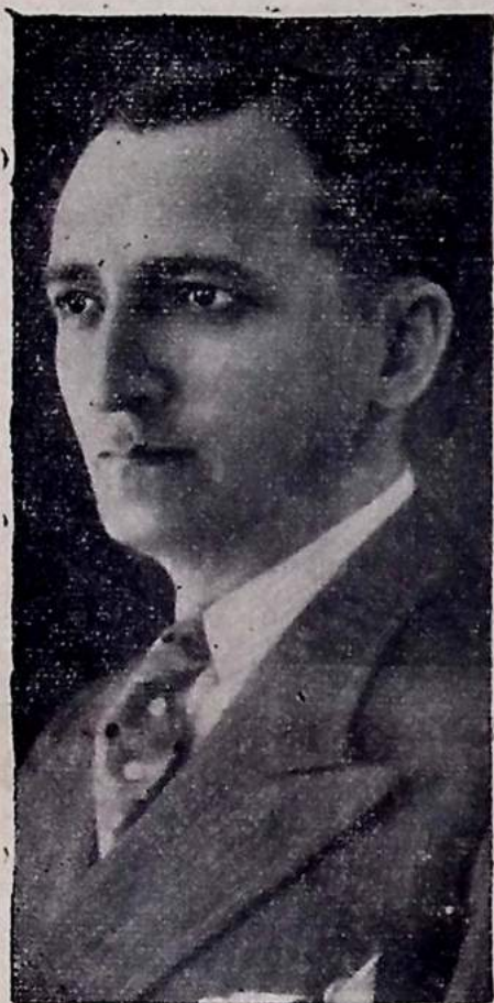
Governador Argemiro de Figueirêdo

S. EXCIA. TOMA DIVERSAS PROVIDENCIAS RELATIVAS AOS SERVIÇOS DE AGUA E ESGOTOS DE CAMPINA GRANDE, CONFERENCIANDO AINDA COM O MINISTRO ODILON BRAGA SOBRE OUTROS INTERESSES DO ESTADO