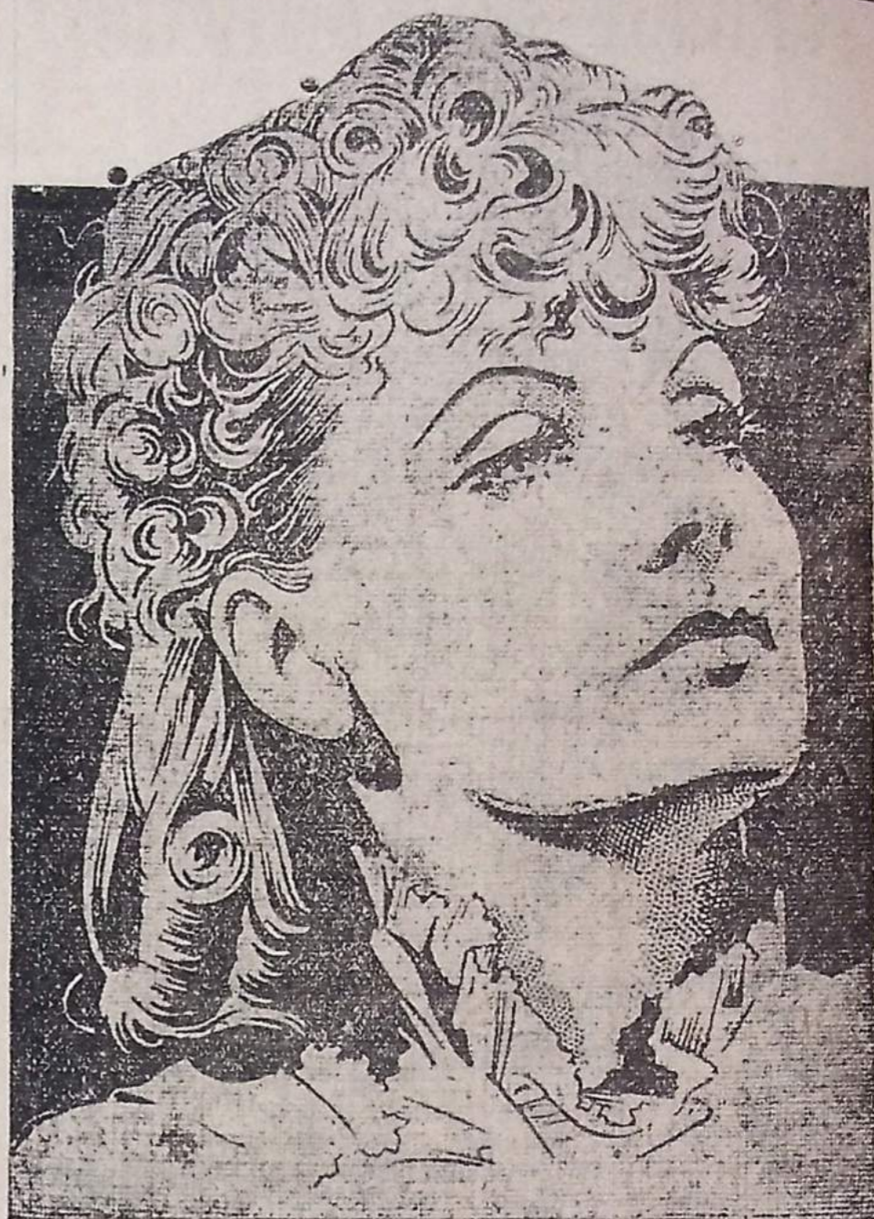
GRETA GARBO, a famosa "estrella" sueca que apparece em "O véu pintado", ao lado de George Brent, o qual será exhibido, amanhã, nas sessões de anniversario do "REX".