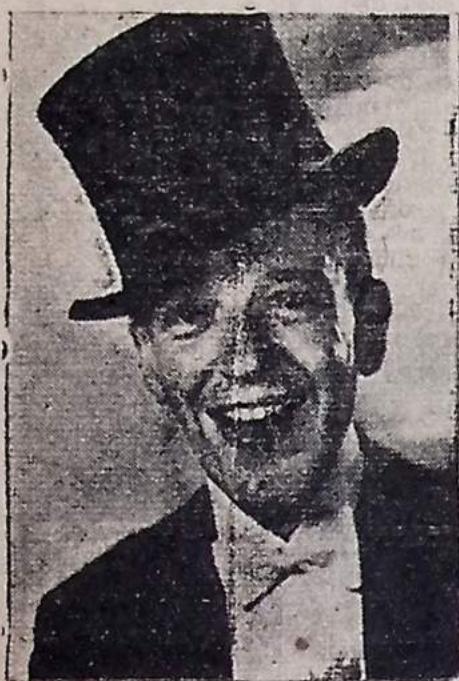
FRED ASTAIRE, o famoso "chançonner" e bailarino que, ao lado da graciosa GINGER ROGERS deliciarà hoje, a platéa do "Rex"

"CRITICA: Com verdadeira habilidade, soube, o director deste film, realizar um trabalho no genero de comédias musicas que foge ao systema adoptado pelos seus collegas, apresentando um argumento bem traçado e definido. De accção frivola, com leves toques sentimentaes, destaca um rythmo vivaz e uma efficiente interpretação por parte de seu elenco de artistas, merecendo especial menção os trabalhos de Ginger Rogers e Fred Astaire e dos notaveis comicos Edward Everett Horton e Alice Brady que emprestam uma brilhante collaboração. Salpicada de fino humorismo que o publico recebe gostosamente e enquadrado em bellissimi