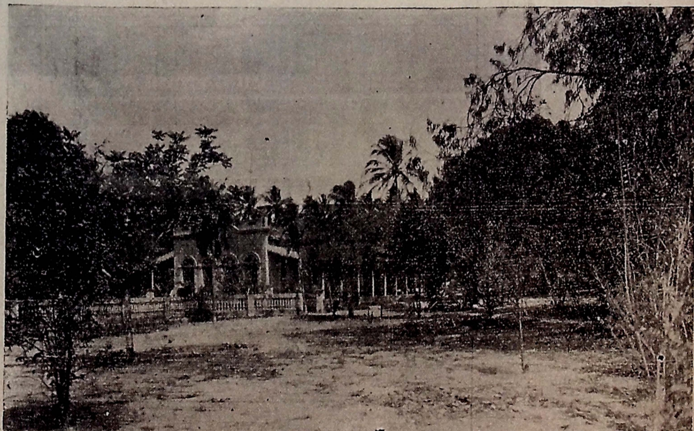
Vista geral do sitio onde será construido o INSTITUTO.