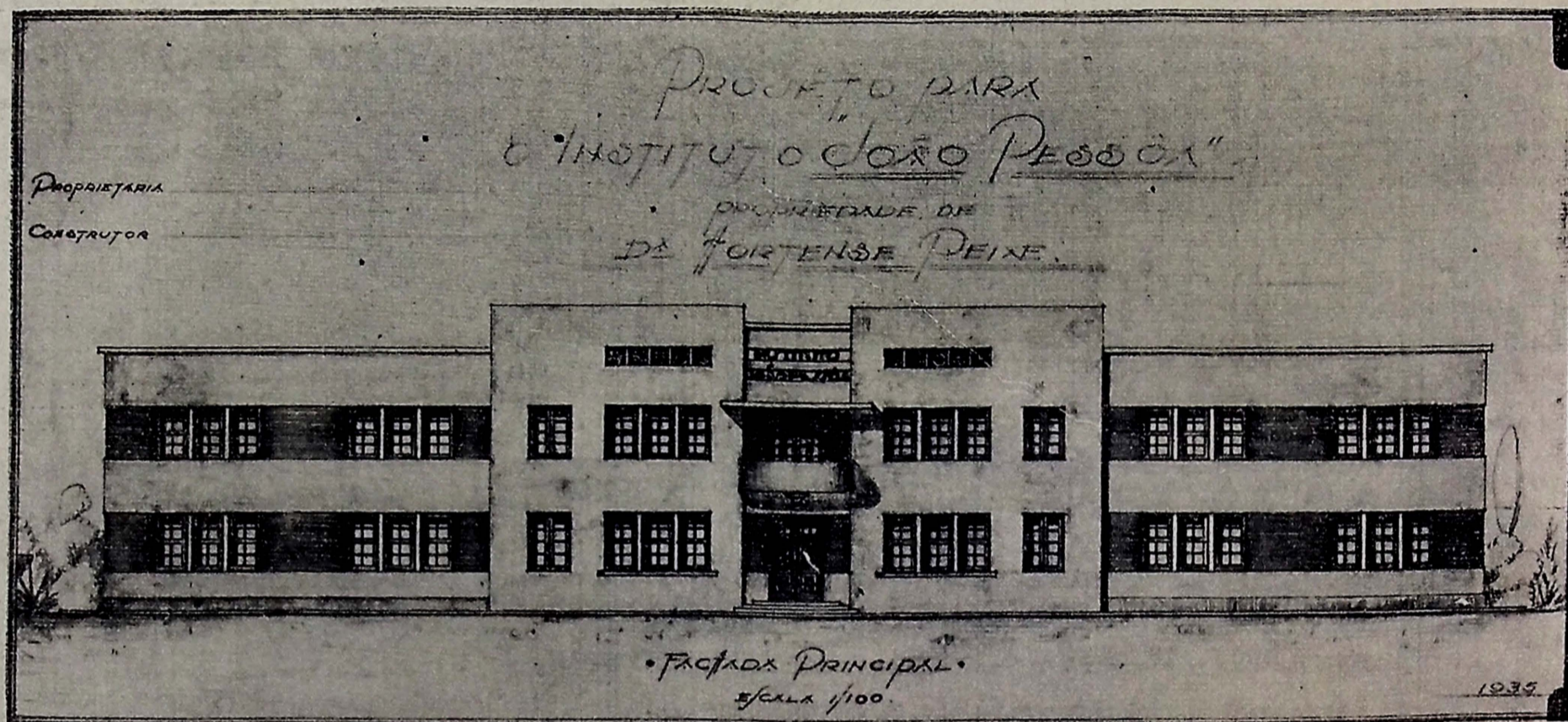
Avenida Vidal de Negreiros.

Dispõe de ASSISTENCIA MEDICA e DENTARIA GRATIS aos seus alumnos.