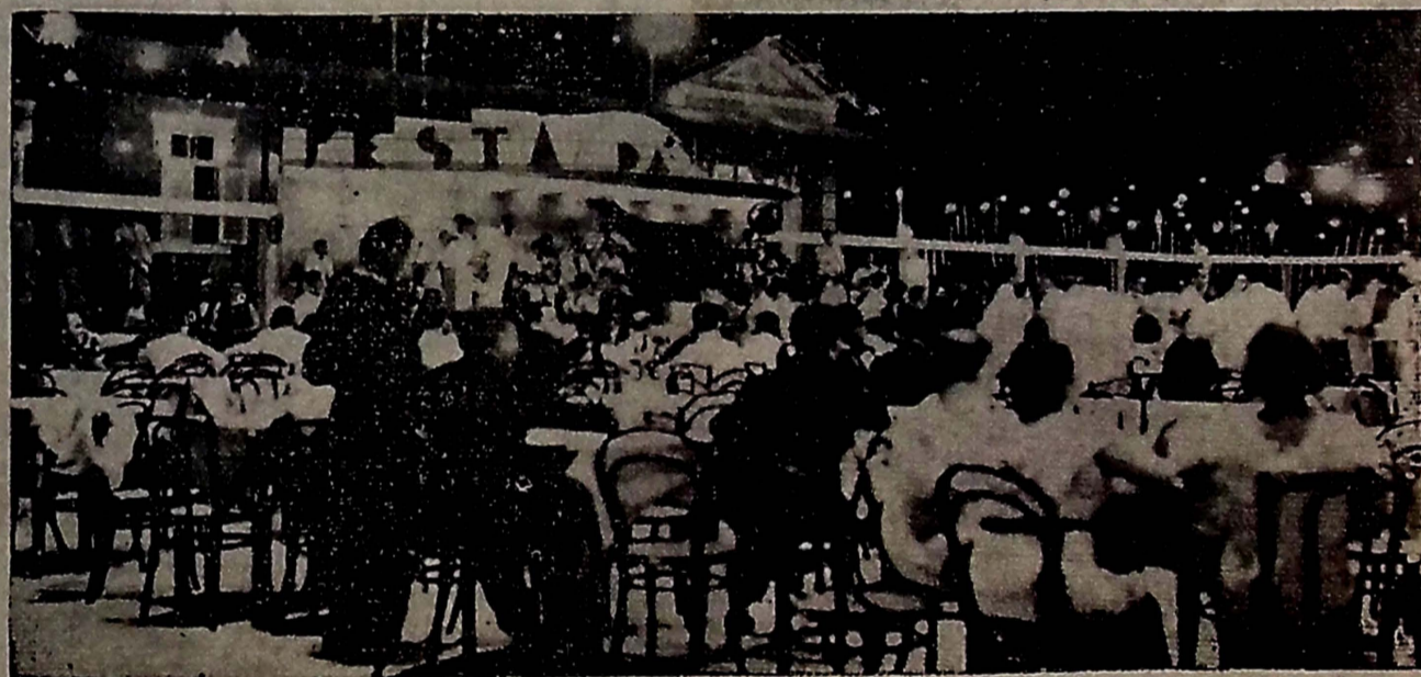
Uma visão feerica da "Festa da Victoria", realizada no "Aéro Clube", de Natal.

S. exc., em resposta, reportou-se longamente ao caso politico local e teve referencias carinhosas para com a nossa terra, ressaltando a figura do governador Argemiro de Figueirêdo, que era "um homem digno e forte á frente de um povo igualmente forte e digno".