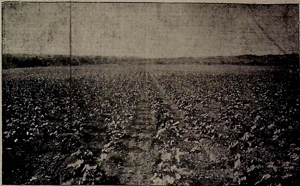
Quem quizer ganhar dinheiro em 1936 deve plantar muito algodão. A campanha dos 100 MILHOES, se victoriosa, enriquecerá os agricultores e fará a prosperidade do Estado.